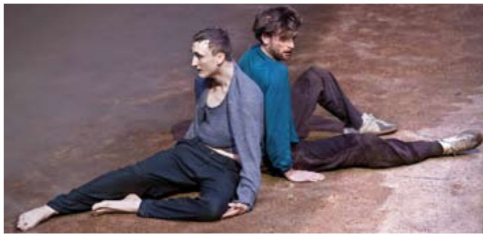
I am the wind, mis en scène par Patrice Chéreau, en ouverture de Chantierseurope.