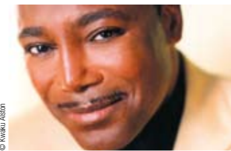
Le guitariste George Benson vient dans le sanctuaire du jazz manouche pour une soirée intitulée « Give Me The Night ».

HÉROS DE LA GUITARE JAZZ AVANT D'ENGRANGER LES GRAMMIES, LE NATIF DE PITTSBURGH VIENT CHEZ DJANGO. CHOC DES CULTURES!