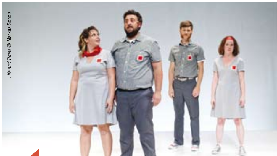
Life and Times © Markus Scholz

2011 / N° 189 DOUBLE JUIN-JUILLET • Paru le mercredi 1 er juin 2011 / 19 e saison / 90 000 ex. / www.journal-laterrasse.fr / Sommaire en page 2