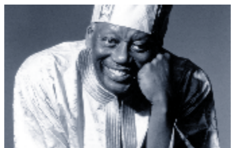
Randy Weston, grand pianiste américain habité par l'Afrique.

LE FESTIVAL QUI NOUS FAIT AIMER LA RENTRÉE