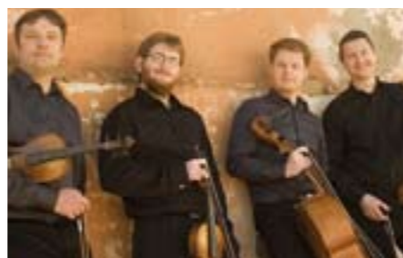
Le Quatuor Debussy est l'hôte de Cordes en ballade, du 5 au 17 juillet.

////// Musiques de chambre ////////////////////////////////////// ANIMÉ PAR LE QUATUOR DEBUSSY, CE FESTIVAL ITINÉRANT TRAVERSE L'ARDÈCHE EN MUSIQUE ET EN TOUTE CONVIVIALITÉ.