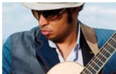
Raul Midon, une voix à part dans le jazz actuel.

RAUL MIDON/RICHARD BONA : CORDES SUBTILES EN OUVERTURE DU FESTIVAL, LE GUITARISTE AMÉRICAIN RAUL MIDON S'ASSOCIE AU BASSISTE CAMEROUNAIS RICHARD BONA.