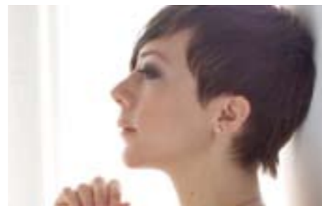
La chanteuse Gretchen Parlato vient de signer avec « The Lost and Found » un troisième album magnifique (chez Obliqsound).

EN JUILLET, LE DUC DES LOMBARDS SE MET À L'HEURE FESTIVALE ET... NEW-YORKAISE.