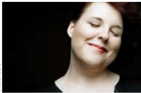
La contralto Marie-Nicole Lemieux.

////// Orchestre symphonique ////////////////////////////////////// LE CHEF ITALIEN ET L'ORCHESTRE NATIONAL DE FRANCE ABORDENT LA HUITIÈME SYMPHONIE DE MAHLER.