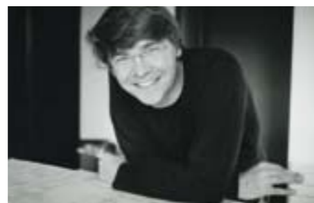
En résidence au festival des Arcs, le compositeur Éric Tanguy présentera sa Sonate pour deux violons , le jeudi 21 juillet à 19h.

////// Musique contemporaine ////////////////////////////////////// À L'IMAGE DU MONT BLANC QUI LE SURPLOMBE, LE FESTIVAL DES ARCS COMBINE EXIGENCE ET GÉNÉROSITÉ.