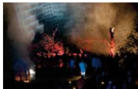
HoriZÔne du Groupe Zur.

LA 26e ÉDITION DU GRAND RENDEZ-VOUS DU THÉÂTRE DE RUE DÉRANGE LES GENRES ET AFFIRME L'ART EN LIBERTÉ!