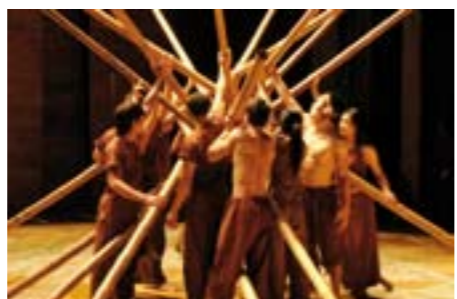
Des artistes vietnamiens et du bambou... et la magie opère dans Lang Tôï mon village.

REPRISE DU SPECTACLE DE CIRQUE MADE IN VIETNAM, CRÉÉ LA SAISON DERNIÈRE AU MUSÉE DU QUAI BRANLY.