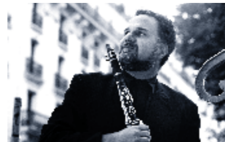
Le clarinetiste David Krakauer est devenu l'icône du revival klezmer.

HABITUÉ DES LIEUX, LE CLARINETTISTE REVIENT AVEC SA FORMULE TELLURIQUE.