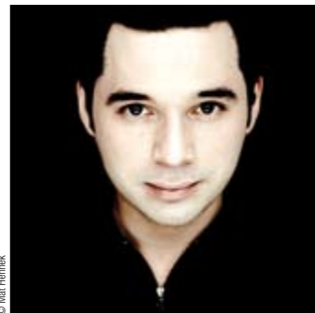
Tugan Sokhiev dirige Aïda les 9 et 12 juillet à 21h45.

Le plus ancien festival lyrique de France (la première représentation lyrique dans le théâtre antique fut le Joseph de Méhul en... 1869) fête cette année sa quarantième édition depuis son renouveau en 1971. On le sait, le lieu se prête particulièrement aux œuvres de grande envergure et les opéras de Verdi notamment y sont souvent présentés. Cette édition 2011 déroge moins que jamais à la règle, avec la reprise de deux ouvrages du compositeur italien. Charles Roubaud a déjà mis en scène Aïda par deux fois devant le « mur » d'Orange, en 1995 puis en 2006, pour des résultats très différents – plus épuré et s'appuyant avec goût sur des projections vidéo pour la production la plus récente. Le metteur en scène cherchera donc à donner de l'œuvre une lecture une fois encore renou-