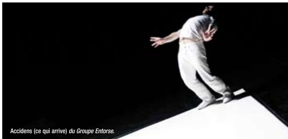
Accidents (ce qui arrive) du Groupe Entorse.