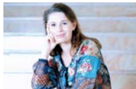
La mezzo française Sophie Koch.

////// De Richard Wagner / Nouvelle production ////////////// SUITE ET FIN DU PÉRIPLÉ WAGNÉRIEN DE PHILIPPE JORDAN ET GÜNTER KRÄMER À BASTILLE.