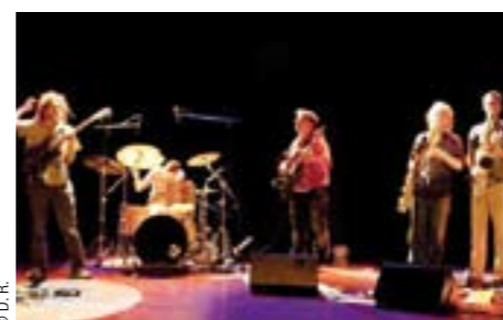
Ras, l'une des découvertes de cette édition en concert le 25 juin à 22h.

PLACE AU JAZZ BOURGOGNE, DU 24 AU 28 JUIN