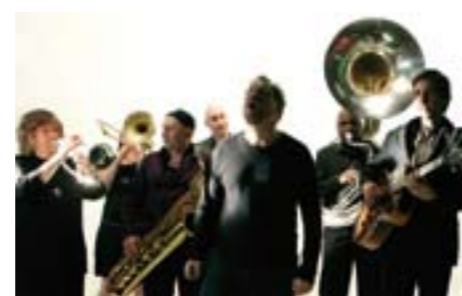
Ce drôle de band interprète la bande-son d'une Amérique à l'écoute du monde.

LE COMBO NEW-YORKAIS SIGNE UN NOUVEL ALBUM INTITULÉ « CICADA » SUR LE LABEL JARO.