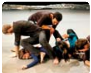
De l'air et du vent

JUSQU'AU 11 JUIN www.theatredelacite.com