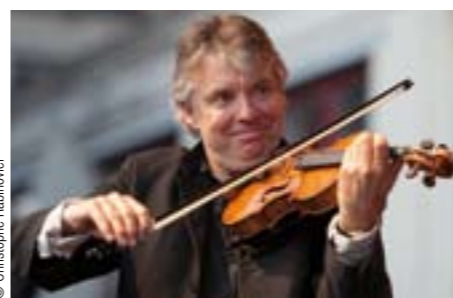
En 1995, il avait déjà collaboré avec le guitariste Mike Stern au sein du projet Didier Lockwood New-York Rendez-vous.

PARRAIN DE JAZZ-MUSETTE AUX PUCES, LE VIOLONISTE FRANÇAIS LE PLUS CÉLÈBRE AU MONDE SERA L'UNE DES TÊTES D'AFFICHE DE CETTE ÉDITION 2011.