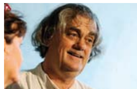
Sigiswald Kuijken dirige l'Académie baroque européenne dans la Messe en si de Bach le 2 octobre.

Musique classique CETTE 32 e ÉDITION SE VEUT UN HOMMAGE PASSIONNÉ À LA MUSIQUE DE BACH, À LA FOIS BAROQUE ET MODERNE, SACRÉ ET DÉSACRALISÉ.