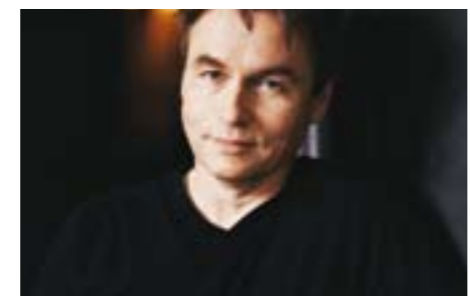
Londonien d'adoption où il dirige aujourd'hui le Philharmonia Orchestra, Salonen est l'invité de l'Orchestre de Paris.

//// Piano et orchestre symphonique //// LE CHEF FINLANDAIS ABORDE DEBUSSY, RAVEL ET BEETHOVEN AVEC L'ORCHESTRE DE PARIS.