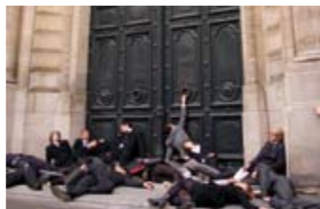
La compagnie n°8 et ses Homo Sapiens Burocraticus sont à Furies.

AGITATEURS DÉCOMPLEXÉS, LES ARTISTES DE FURIES INVESTISSENT CHÂLONS-EN-CHAMPAGNE LE TEMPS D'UNE 22e ÉDITION QUI BOULEVERSE LES ESPACES ET LES ESPRITS. En salle, en cirque ou dans la rue, la perturbation est à son comble pendant une semaine à Châlons,