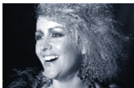
L'an dernier elle a fait partie des voix invitées à participer au concept album mené par Fatboy Slim et David Byrne, « Here Lies Love ».

LA DIVA SOUL BRITANNIQUE SERA L'UNE DES ATTRICTIONS PHARE DE CES SEPTIÈMES ARÈNES DU JAZZ.