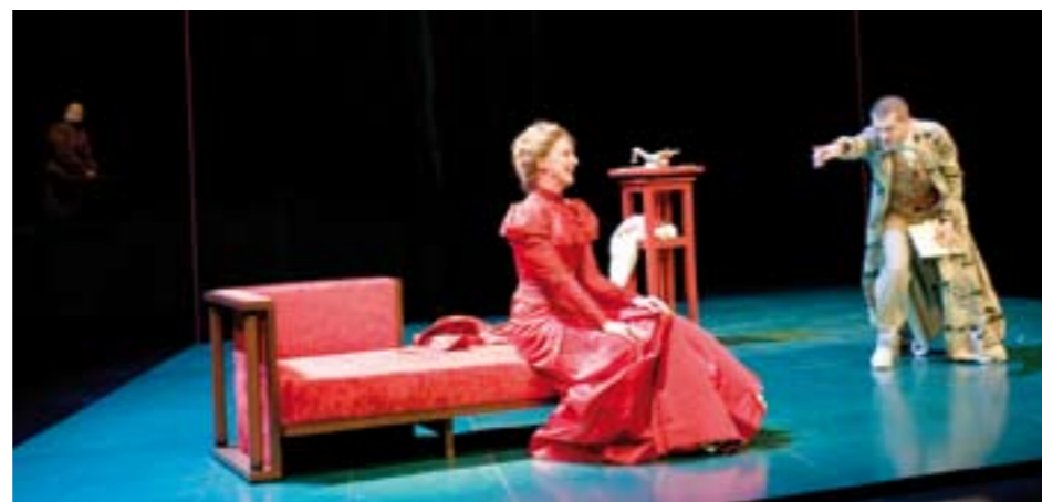
Un trio d'acteurs flamboyants pour Créanciers .

du pouvoir de fascination des jupes comme des baisers étouffants féminins, dit la voix maléfique à sa victime. Tekla n'est qu'une coquette, une aguicheuse qui trompe son monde; elle a mis à bas l'art authentique de son époux. La pièce décline un inventaire de griefs entre mari et femme extraordinairement moderne, un cumul acide de ratés et de petits manquements et arrangements mutuels et réciproques, qui étouffent les âmes les plus dégagées. La scénographie de Renaud de Fontainieu est pure, glacée et vernissée, un espace dédoublé, séparé par un voilage qui satisfait le voyeurisme de l'ex-mari, propice à ses agissements manipulateurs inavouables. Le fameux