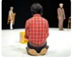
Already Made © Frederic Iovino