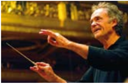
Le chef d'orchestre Jean-Claude Casadesus a fêté cette saison les 35 ans de son Orchestre National de Lille.

////// Oratorio ////////////////////////////////////// LE CHEF LILLOIS DIRIGE LE REQUIEM ALLEMAND DE BRAHMS.