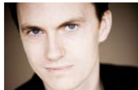
Alexandre Tharaud interprète Scarlatti et Beethoven.

Cultivant avec science et honnêteté sa différence, le pianiste français a développé au fil des années une capacité unique en son genre à choisir et ciseler son répertoire, avec une liberté et une intelligence qui forcent l'admiration. Chacun de ses enregistrements est le fruit d'une réflexion profonde, braquant sur des partitions une lumière neuve et personnelle, déroutante parfois mais toujours convaincante. Il