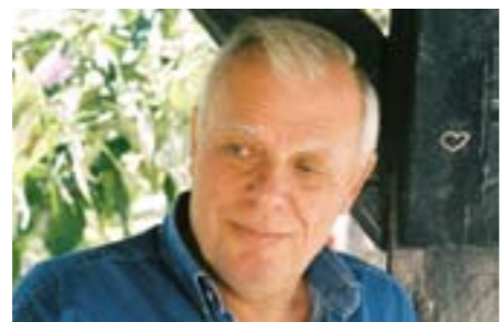
António Lobo Antunes.