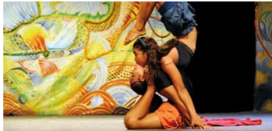
Putho ! avec des acrobates du Cambodge.

Circus Platform est un parcours de cirque estival à l'échelle du Grand Paris comprenant trois escaliers : les Impromptus à l'Académie Fratellini en Seine-Saint-Denis, le festival Solstice à Antony/Châtenay-Malabry dans les Hauts-de-Seine et le Cirque de l'été au Parc de la Villette à Paris. Solstice prend ses marques du 17 au 23 juin