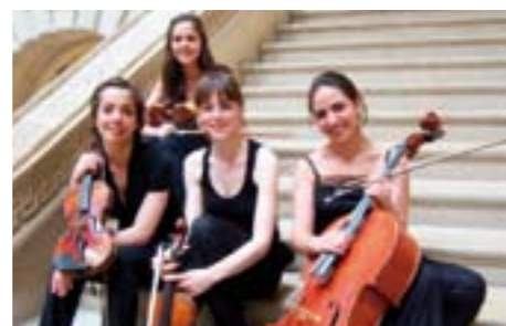
Le Quatuor Zaïde joue au Festival du Luberon du 21 au 24 août.

Musiques de chambre LA MANIFESTATION ACCUEILLE DES CONCERTS DE FORMATIONS DE PREMIER PLAN ET UNE ACADEMIE POUR JEUNES QUARTETTISTES.