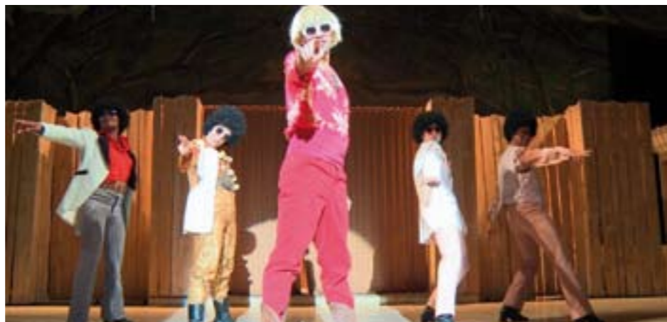
De savoureuses parodies des shows populaires issus de la culture afro-américaine.

DES BLANCS GRIMÉS EN NOIRS IMITENT DES NOIRS QUI SINGENT DES BLANCS... MARK TOMPKINS S'INSPIRE DES « MINSTREL SHOWS » QUI SE DÉVELOPPÈRENT AU XIX e SIÈCLE AUX ÉTATS-UNIS.