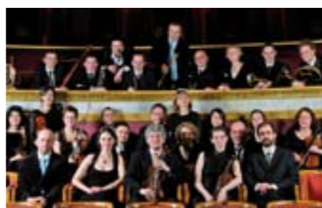
Les Folies Françaises célèbrent la Vierge , de Charpentier à Bacri, le 25 juin à 17h.