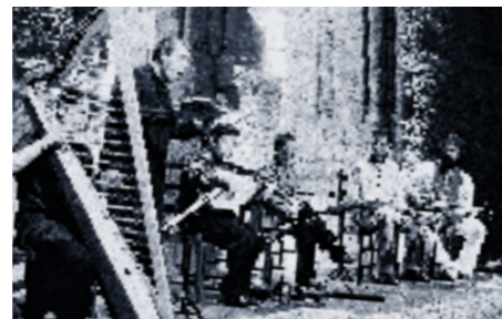
L'ensemble Douce Mémoire interprétera Caccini le lundi 15 août à 21h.

////// Musique Ancienne ////////////////////////////////////// CETTE ANNÉE, LE FESTIVAL DE SIMIANE SE MET AU VERT.