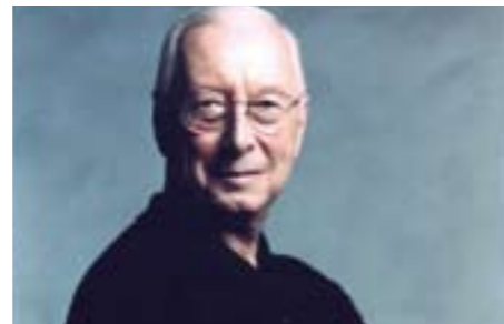
William Christie, chef et fondateur des Arts Florissants.

////// De Lully / Reprise ////////////// APRÈS SA RECRÉATION EN MAI DERNIER À L'OPÉRA COMIQUE, LA PRODUCTION HISTORIQUE DE CHRISTIE ET VILLÉGIÉRI S'INSTALLE À L'OPÉRA ROYAL DU CHÂTEAU DE VERSAILLES.