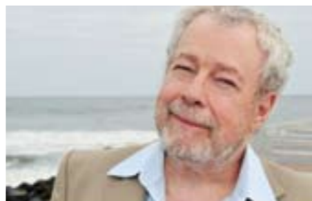
Nelson Freire, monstre sacré du piano, joue à Auvers-sur-Oise le 4 juin.

////// Musique classique ////////////// HOMMAGE À LISZT ET RECRÉATION MONDIALE SONT AU MENU DE LA 31 e ÉDITION DU FESTIVAL.