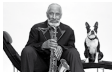
L'événement de l'été à Vienne : Sonny Rollins en concert!

Depuis sa création en 1980, le festival s'est imposé comme l'un des grands festivals européen, bénéficiant à la fois du cadre unique du Théâtre antique comme lieu d'accueil des concerts, d'une dynamique de public exemplaire et d'une programmation spectaculaire dominée par les stars. Impossible de passer en revue l'ensemble de la programmation mais comment ne pas souligner la présence du très rare Mister Tom Jones en personne en ouverture du festival, crooner majuscule, mais aussi celle de Sonny Rollins? Déjà présent au festival en 2006, le colosse