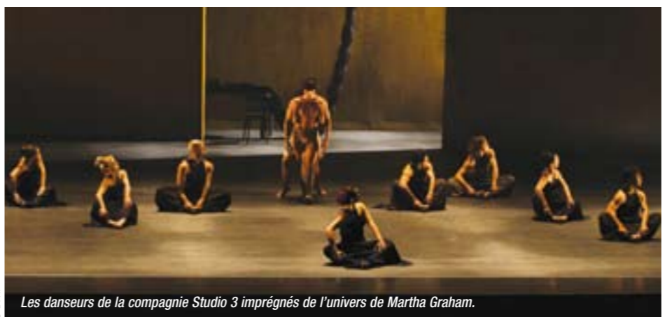
Les danseurs de la compagnie Studio 3 imprégnés de l'univers de Martha Graham.

Ils ont ainsi rêvé certains moments et entre liberté et fidélité, ils donnent à voir des pans de vie et de