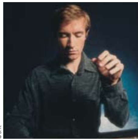
Nikolai Lugansky, le prince de l'école russe de piano, joue Rachmaninov le 25 juillet.

Il y en aura pour tous les goûts. Ceux qui aiment le piano virtuose, brillant, ne manqueront pas Yuja Wang, la prodige chinoise qui commence à faire de l'ombre à Lang Lang (le 23 juillet). Ceux qui préfèrent le piano aristocrate, tout aussi impeccable digitalement mais plus intérieur, iront entendre Nikolai Lugansky (le 25 juillet), tandis que les amoureux du piano sombre, profond réserveront leurs places pour Brigitte Engerer dans l'intégrale des Harmonies poétiques et religieuses de Liszt (le 3 août). Génie imprévisible et toujours inspiré, Grigory Sokolov donnera quant à lui un récital au