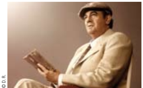
Au Châtelet, Placido Domingo incarne le rôle du poète Pablo Neruda.

//// Création //// L'OPÉRA DE DANIEL CATAN EST À L'AFFICHE DU THÉÂTRE DU CHÂTELET, AVEC EN « GUEST STAR » PLACIDO DOMINGO.