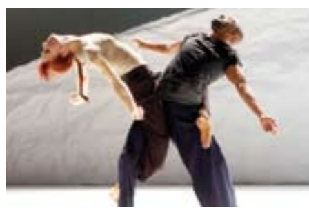
Les deux monstres sacrés Sylvie Guillem et Akram Khan sont à Vaison cet été.

En débutant le festival par l'Alvin Ailey American Dance Theater, c'est tout un pan de la culture