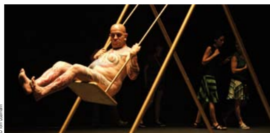
Pour la première fois au Festival Montpellier Danse, le performeur Franko B.

Les Étés de la danse. Du 6 au 23 juillet, le Miami City Ballet au Théâtre du Châtelet, 1, place du Châtelet, Paris 1 er . Réservations : +33 (0) 1 40 28 28 40 et www.chatelet-theatre.com Du 8 au 17 septembre, In Paris, par le Baryshnikov Arts Center et le Dmitry Krymov Laboratory, au Théâtre national de Chaillot, place du Trocadéro, Paris 16 e . Réservations : 0 892 683 622 et www.fnac.com