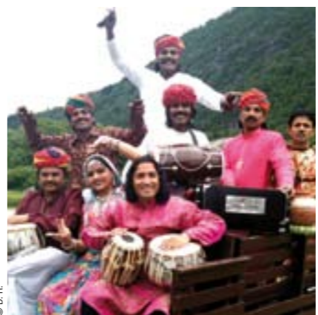
Les Gitans du Dhoad entre épopée gypsy et carrefour culturel du Rajasthan, au festival de l'Oh!

En invitant cette année l'Inde, ce festival, dédié à l'eau depuis 11 ans, emprunte deux voies. La voie du Gange - concrète et symbolique - qui oriente nécessairement cette édition vers une sensibilisation aux questions écologiques, aux retombées internationales. Agro-alimentaire, urgences climatiques, économie mondiale : l'Inde est un carrefour humain et un nœud de réseaux où la