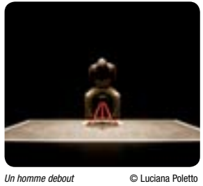
Un homme debout © Luciana Poletto

DU 8 AU 28 JUILLET 2011 - 20H45, RELÂCHE LE 18 www.lamanufacture.org