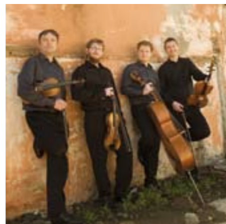
Le vendredi 3 juin à 20h45, le quatuor Debussy rapprochera Haydn, Debussy et Webern.

Il est étrange que, dans la frénésie festivalière estivale, peu d'événements soient consacrés exclusivement au quatuor. Cette formation a pourtant inspiré tant de compositeurs de grand talent qu'elle jouit d'un répertoire aussi varié que somptueux, aussi immense que méconnu. C'est fort de ce constat qu'est né le festival Quatuor à l'Ouest. En la matière, le territoire français est un