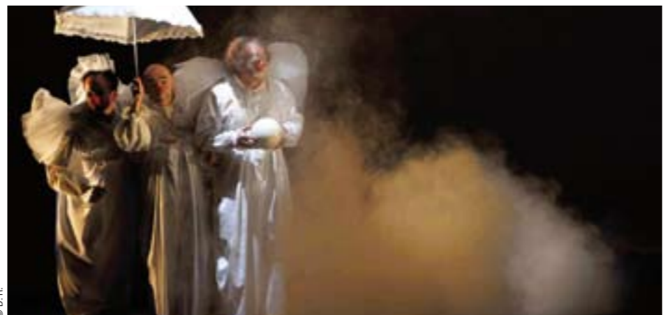
Pentimento, de Madona Bouglione d'après Le Lac des Cygnes.

En 1992, les usines Renault se taisaient définitivement sur l'île Seguin, qu'elles occupaient depuis 1929. Deux décennies et quelques projets d'aménagement après, la friche industrielle de 74 hectares commence sa mue, dessinée par les lignes inventives de l'architecte Jean Nouvel. Constituant l'un des plus importants pôles