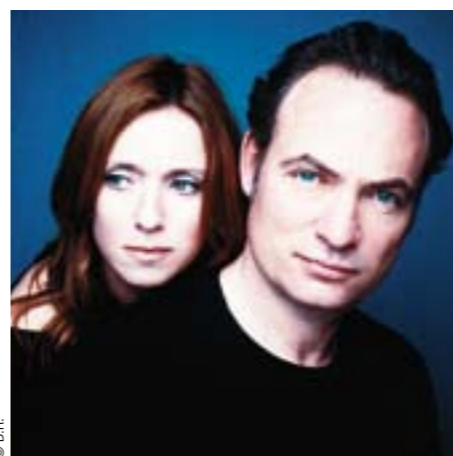
Léa Drucker et Gilles Cohen

Le huis-clos improbable de ces personnages évoque leur impossibilité à assumer la solitude tout autant que la compagnie des hommes. Au-delà du handicap physique des corps malades et vieilliss, et de l'âme blessée, ne reste que le verbe qui inscrit l'ultime présence au