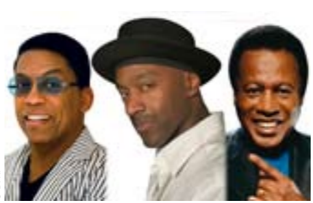
Trio de choc pour un hommage à Miles : Herbie Hancock, Wayne Shorter et Marcus Miller.

JAMAL, HANCOCK, SHORTER, MARCUS MILLER... LES PARISIENS DE JUILLET TIENNENT DÉJÀ LEUR REVANCHE SUR TOUS CEUX QUI PARTIRONT SUR LA ROUTE DES FESTIVALS!