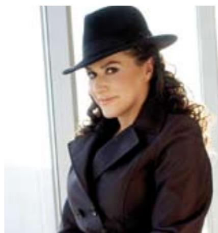
Cecilia Bartoli chante Vivaldi dans deux lieux mythiques du Château de Versailles : la Galerie des glaces (le 27 juin) et l'Opéra Royal (le 29 juin).