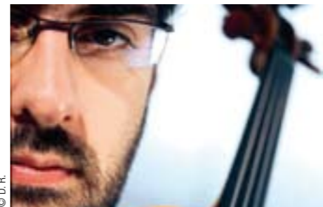
Le violoniste Leonidas Kavakos, le 24 juin à 20h à la Salle Pleyel dans le Concerto de Brahms.

//// Orchestre symphonique //// LE CHEF CORÉEN CONCLUT SA SAISON À LA SALLE PLEYEL.