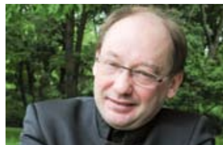
Wojciech Świątała, interprète majeur et méconnu de Chopin, le 19 juin à 17h.

Musique classique SIX CONCERTS DOMINICAUX (ET GRATUITS) AUTOUR DE LA MUSIQUE DE CHOPIN.