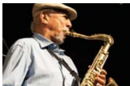
Le dernier disque de Charles Lloyd sorti sur le label ECM (« Mirror ») offre un saisissant arrangement du Caroline No des Beach Boys.

Pour leur septième année de beaux et joyeux services, les Arènes du Jazz s'installent une nouvelle fois et pour six jours, à deux pas du Sacré-Cœur, dans un lieu étonnant : des arènes à ciel ouvert qui s'imposent comme un havre de paix musical en plein milieu du grand raout des touristes montmartrois. Mais tout cela ne serait que littérature si les invités de cette manifestation jazz ne valaient pas le déplacement. L'événement de cette édition 2011, c'est la venue d'une pinture du saxophone, Charles Lloyd, qui ouvre le festival le 21 juillet avec son quartette de rêve composé d'une