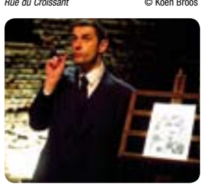
Rue du Croissant

DU 8 AU 28 JUILLET - 16H30, RELÂCHE LE 18 www.lesdoms.eu