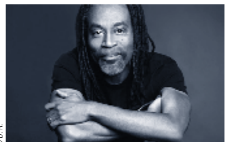
Bobby McFerrin, une voix extraterrestre.