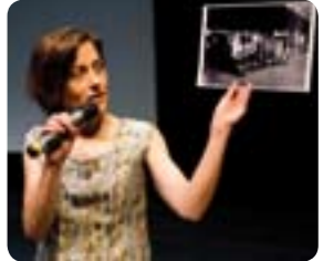
Une introduction

LE 20 JUIN - 18H De Găban Bulouder. Référence directe à Marcel Duchamp.