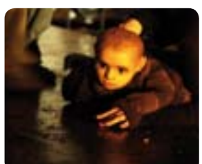
Éloge de l'oisiveté

DU 8 AU 24 JUILLET - 21H45, RELÂCHES LES 14 ET 21 www.circuits-circa.com