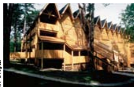
La Grange au lac construite par Patrick Bouchain accueille les concerts des Escapes musicales.

Musique classique DIRIGÉ PAR LAURENCE DALE, LE FESTIVAL MET À L'HONNEUR LE TROMPETTISTE OTTO SAUTER.