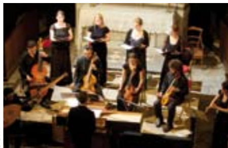
Le mardi 26 juillet à 21h, l'ensemble Correspondances interprétera un programme autour de Marc-Antoine Charpentier.

Musiques anciennes LE FESTIVAL MUSIQUE ET MÉMOIRE QUESTIONNE NOTRE RAPPORT À LA MUSIQUE BAROQUE.