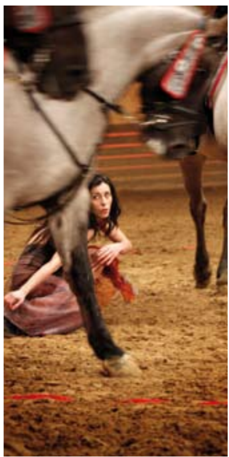
Ensemble, danseurs et chevaux partagent l'expérience de la création avec Bartabas et Carolyn Carlson.

maître, « ils pourraient se confronter à un grand chorégraphe et jouer vraiment ensemble le jeu