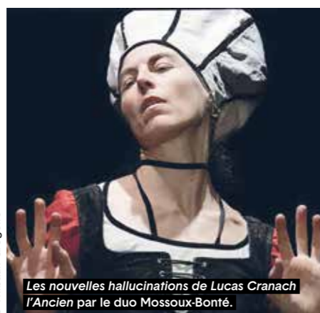
Les nouvelles hallucinations de Lucas Cranach l'Ancien par le duo Mossoux-Bonté.

Les écritures scéniques s'y déploient avec force : MIRARI d'Emmanuelle Vo-Dinh, où les corps se défont de leur humanité pour devenir paysages, chimères ou éclats lumineux ; Les nouvelles hallucinations de Lucas Cranach l'Ancien du duo Mossoux-Bonté, machine de visions où les figures picturales surgissent, troublantes, entre sensualité, duplicité et menace. Avec De Fugues... en Suites... , Salia Sanou fait dialoguer Bach, kora et balafon dans une jubilation du mouvement, portée par un sextuor féminin d'une intensité rare. Le festival accueille aussi des formes plus intimes, tels le Sacre de Daniel Larrieu au Prieuré Saint-Cosme, la générosité débridée de Silvia Gribaudi, Autothérapie , l'autoportrait sans filtre