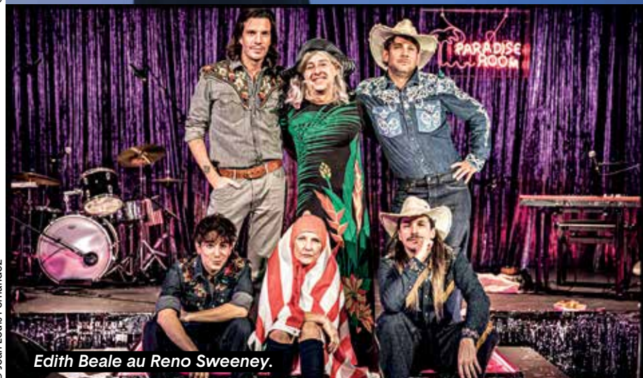
Edith Beale au Reno Sweeney.