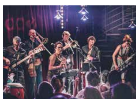
Cumbia Ya! Une sacrée bande qui s'inscrit dans la tradition afro-colombienne.

Cumbia Ya! réunit onze musiciennes et musiciens qui creusent le fertile sillon de la musique colombienne, pour en faire jaillir une musique de danse.