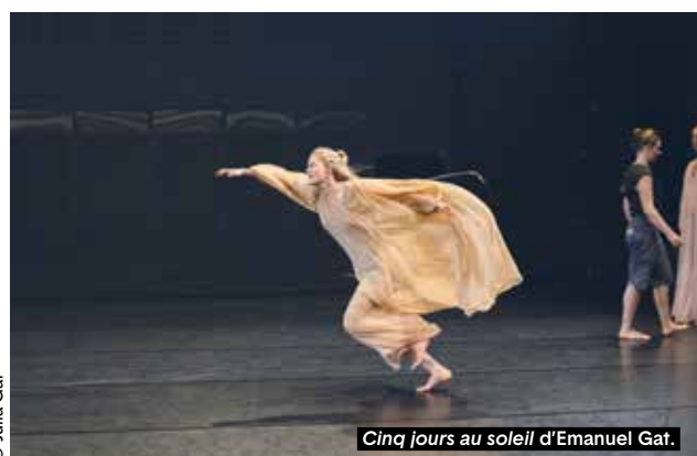
Cinq jours au soleil d'Emanuel Gat.