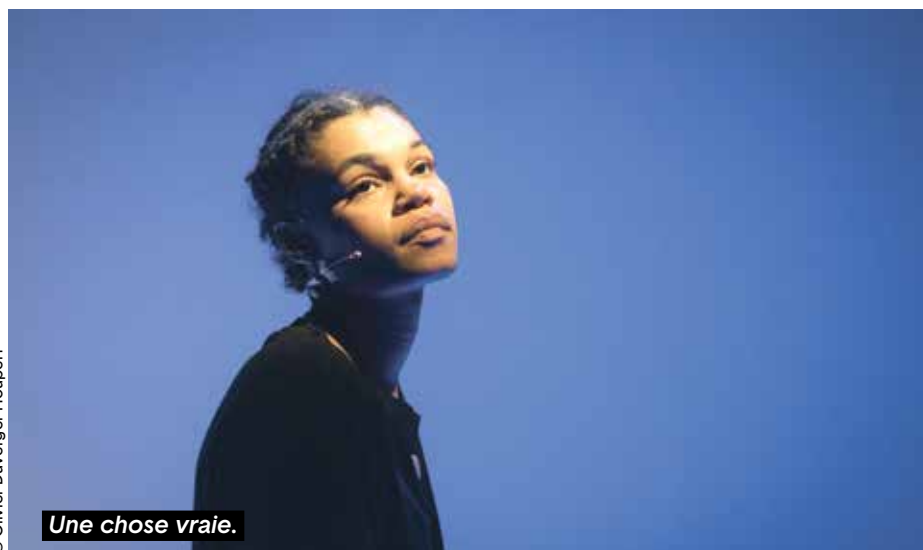
Une chose vraie.