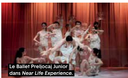
Le Ballet Preljocaj Junior dans Near Life Experience.

Les jeunes danseurs en donnent une incarnation lumineuse, traversant l'espace comme on franchit un seuil, entre veille et abandon, entre souffle et suspension. Leurs corps sculptent l'air, se dépliant, comme si chaque geste ouvrait une brèche vers un ailleurs. Le fil rouge qui parcourt la scène tel un cordon ombilical, un lien indéfectible, devient sous leurs mains