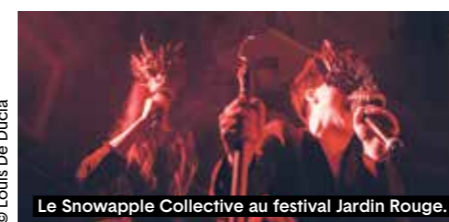
Le Snowapple Collective au festival Jardin Rouge.

Comme l'an passé, le thème de cette édition est Wilderness , soit « état sauvage ». Les formes d'expression scéniques se croisent pour remettre en question les codes de l'art, faisant du Jardin Rouge un cabaret non domestiqué et engagé, qui n'oublie pas notre contexte social contemporain. La création devient