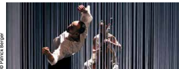
Labes, de Selim Ben Safia.

Des artistes issus de pays du pourtour méditerranéen ou de leurs diasporas sont à l'affiche, avec la complicité du chorégraphe franco-tunisien Selim Ben Safia.