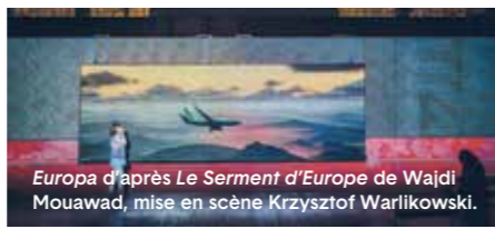
Europa d'après Le Serment d'Europe de Wajdi Mouawad, mise en scène Krzysztof Warlikowski.