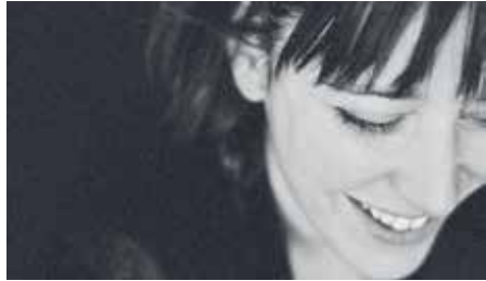
Charlotte Planchou et Andy Emler.

Quand deux grands artistes se croisent, il faut s'attendre à un petit miracle. Charlotte Planchou est un phénomène vocal alors qu'Andy Emler a accompagné au piano les plus grands artistes de jazz.