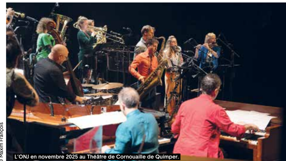
L'ONJ en novembre 2025 au Théâtre de Cornouaille de Quimper.

Bal, concert, jam, conférence et... grand final pour célébrer 40 ans de créations.