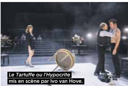
Le Tartuffe ou l'Hypocrite mis en scène par Ivo van Hove.