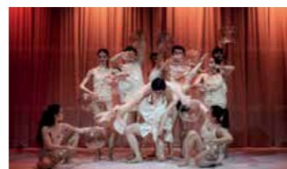
Le Ballet Preljocaj Junior dans Near Life Experience .