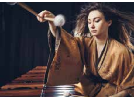
La percussionniste Vassilena Serafimova.

Opéra de Massy, 1 place de France, 91300 Massy. Le 22 mai à 20h et le 24 mai à 16h. Tél.: 01 60 13 13 13. Durée: 2h45 avec 1 entracte.