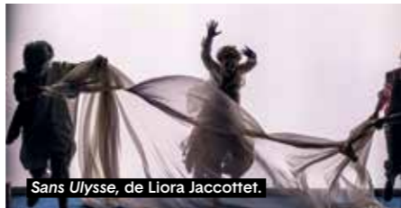
Sans Ulysse, de Liora Jaccottet.

La Colline - Théâtre national. 15 rue Malte-Brun, 75020 Paris. Le mardi 26 et le vendredi 29 mai, le mercredi 3, le samedi 6 et le jeudi 11 juin 2026 à 20h ( Le Flix et Abattoir-abattoir ). Le mercredi 27 et le samedi 30 mai, le jeudi 4, le mardi 9 et le vendredi 12 juin à 20h ( Tout va bien et Au nom de la mère ). Le jeudi 28 mai, le mardi 2, le vendredi 5, le mercredi 10 et le samedi 13 juin à 20h ( Bouche-cousue et La Petite Vie de Pierre-Joseph Dracque ). Tél. : 01 44 62 52 52. colline.fr