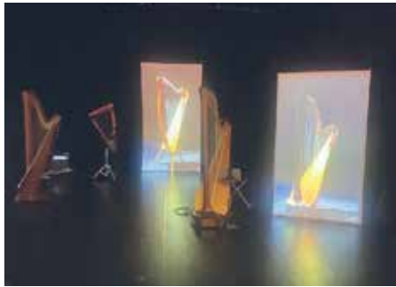
Le dispositif scénographique pour Guêpes, grenouilles et monstres d'Aurélié Saraf

Des lieux et des musiques comme célébration rassembleuse Juste diapason, la première soirée sera placée sous le signe du double héritage: François Rabbath, émérite contrebassiste – écoute donc The Sound Of Bass , daté de 1963 – retrouvera son fils, le pianiste Sylvain Rabbath, pour prolonger sur scène le disque qu'ils ont récemment cosigné. Ils seront suivis du duo Shiran et Bakal qui célèbre leurs racines à travers Electro Baghdad. Une belle mise en bouche, qui plus est dans la cadre tout à fait approprié du couvent des Récollets. Le lendemain, place à la réunion d'artistes activistes israéliens et palestiniens, Ripples Collective, qui entend bien proposer une vision du futur,