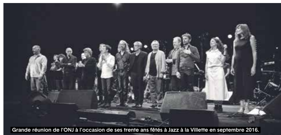
Grande réunion de l'ONJ à l'occasion de ses trente ans fêtés à Jazz à la Villette en septembre 2016.