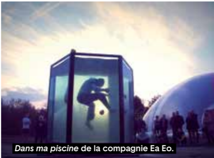
Dans ma piscine de la compagnie Ea Eo.

qui l'ont portée aux quatre coins du monde, la jouent à nouveau cette saison au Théâtre de l'Atelier. On partage totalement l'engouement qu'a suscité cette implacable clôture de l'amour, tant la pièce non seulement touche des enjeux humains universels, mais aussi fait du langage comme de l'art de l'acteur un moyen d'expression qui va au bout de ses possibilités, qui se fait incarnation tranchante, qui solde les comptes et libère un jusqu'au-boutisme, une radicalité et une violence inouïs. Une violence au présent et une violence qui abîme le passé.