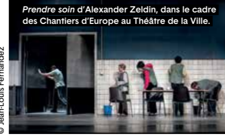
Prendre soin d'Alexander Zeldin, dans le cadre des Chantiers d'Europe au Théâtre de la Ville.

Spectacle phare de cette onzième édition des Chantiers d'Europe, Prendre soin d'Alexander Zeldin, le dramaturge anglais qui renouvelle le naturalisme au théâtre, souvent vu comme le Ken Loach des planches, donne le ton d'une édition placée sous le signe du « care » pour le dire en anglais. « Face à la guerre, à la montée des nationalismes, aux fractures sociales, aux silences imposés et aux voix étouffées, les artistes européens semblent nous dire : prenons soin », explique Emmanuel Demarcy-Mota dans l'éditorial de cette édition 2026 qui renoue, outre cet ancrage britannique, avec le tropisme méditerranéen du projet d'origine. Artistes grecs, espagnols, italiens et portugais constituent ainsi une part importante d'une programmation croisant spectacles de danse, de théâtre et de musique. Dans cette perspective, le dernier opus de Bob Wilson fait le pont. Le créateur disparu en juillet 2025 avait créé Pessoa, since I've been me l'an dernier au Théâtre de la Ville. Son regard sur l'œuvre du légendaire auteur portugais Fernando Pessoa et son langage scénique unique sont l'autre grand pôle d'attraction de cette édition.