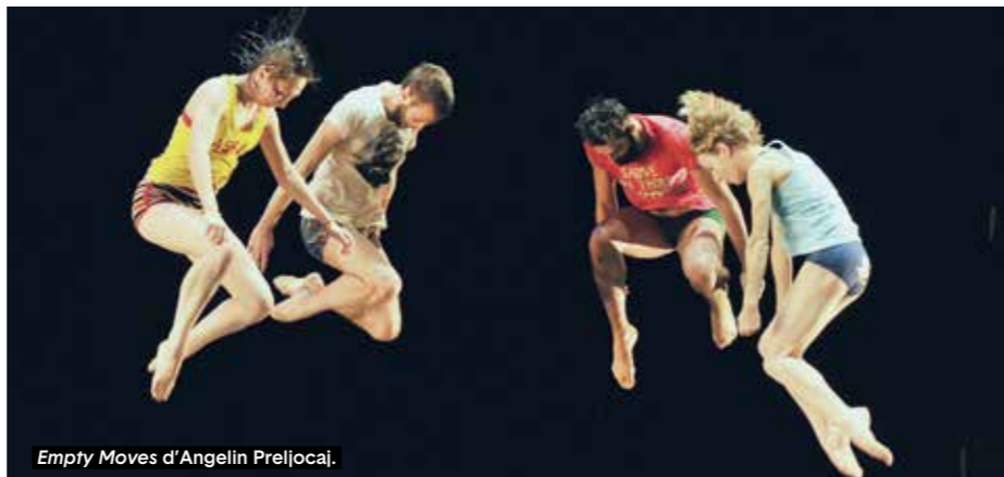
Empty Moves d'Angelin Preljocaj.

Le Carreau du Temple, 2 rue Perrée, 75003 Paris. Le 22 mai à 21h et le 23 mai à 20h30, dans le cadre du Festival Jogging. Tél.: 01 83 81 93 30.