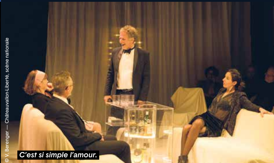
C'est si simple l'amour.