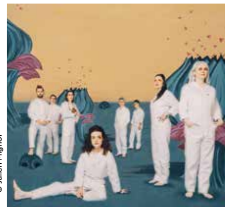
La Planète sauvage.

S'inspirant du film culte La Planète sauvage , signé en 1973 par René Laloux, l'ONJ revisite excellemment le voyage en mêlant les arts. Dès 10 ans.