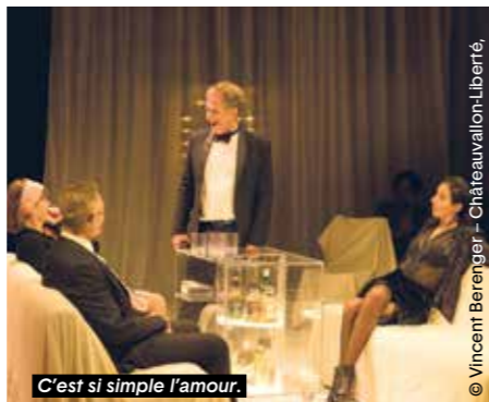
C'est si simple l'amour.

ont adoré la pièce. Elle est comédienne en quête de rôle depuis plusieurs années, lui est psychologue. Nous sommes immergés dans un intérieur « cozy », quoique dans la scénographie de Charles Berling et Marco Giusti tous les meubles sont couverts de draps blancs, comme si le lieu quelque peu irréal était déjà habité par l'absence de vie. Il est vrai qu'ici on s'enfoncé délicieusement dans le canapé « comme dans une tombe ». Du début à la fin, comme une échappatoire qu'on a sous la main, l'alcool coule à flots, faisant sauter les verrous des faux-semblants et déliant les langues. Tout le reste, tous les signes d'un confort bourgeois ordinaire finiront jetés au sol avec