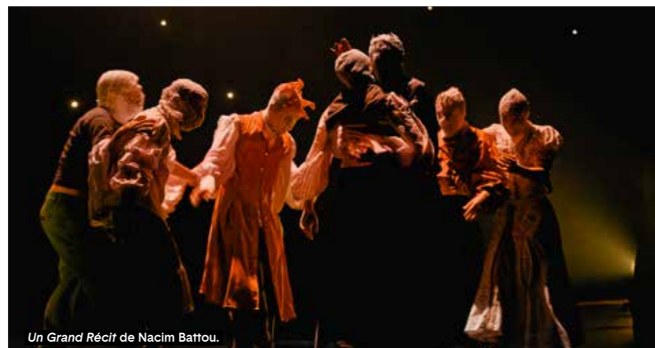
Un Grand Récit de Nacim Battou.

Après le succès de Dividus , Nacim Battou, artiste associé à Théâtres en Dracénié, invente une fresque historique pour mettre en lumière ceux qui ont lutté ou luttent encore au quotidien pour nous amener vers un futur désirable.