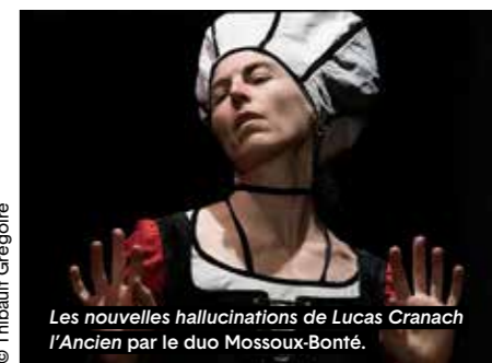
Les nouvelles hallucinations de Lucas Cranach l'Ancien par le duo Mossoux-Bonté.

Les écritures scéniques s'y déploient avec force : MIRARI d'Emmanuelle Vo-Dinh, où les corps se défont de leur humanité pour devenir paysages, chimères ou éclats lumineux ; Les nouvelles hallucinations de Lucas Cranach l'Ancien du duo Mossoux-Bonté, machine de visions où les figures picturales surgissent, troublantes, entre sensualité, duplicité et menace. Avec De Fugues... en Suites... , Salia Sanou fait dialoguer Bach, kora et balafon dans une jubilation du mouvement, portée par un sextuor féminin d'une intensité rare. Le festival accueille aussi des formes plus intimes, tels le Sacre de Daniel Larrieu au Prieuré Saint-