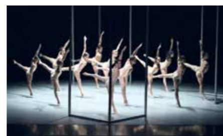
Midi-Minuit de Thierry Malandain.

Théâtres en Dracénié, Théâtre de l'Esplanade, Bd Georges Clémenceau, 83300 Draguignan. Le 14 mars à 20h30. Tél. 04 94 50 59 59. Durée : 1h45. Dans le cadre du festival L'impruDanse.