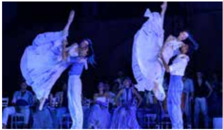
Core Meu de Jean-Christophe Maillot.

L'extraordinaire Core Meu revient à Monaco dans une nouvelle version plus longue. La promesse d'un bonheur électrisant.