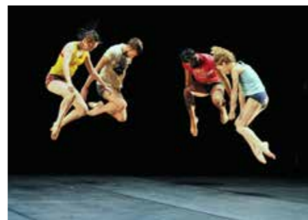
Empty Moves d'Angelin Preljocaj.

Proposé par le Théâtre 71- Scène nationale de Malakoff, le festival Mai Danse! dessine un paysage où se côtoient rituels contemporains, écritures subtiles et fictions sensibles.