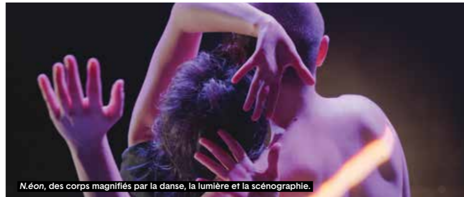
N.éon , des corps magnifiés par la danse, la lumière et la scénographie.

L'infinie traversée du corps Mention spéciale pour les trios, sommets de sensualité douce et heureuse. Le premier s'at-