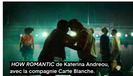
HOW ROMANTIC de Katerina Andreou, avec la compagnie Carte Blanche.

Pluralité des langages Avec BABEL – Torre Viva , David Coria convoque le mythe biblique pour en faire une allégorie brûlante du présent. Nourrie par l'énergie du flamenco et une physicalité rituelle, la pièce transforme la fragmentation des langages en matière chorégraphique que l'on pourra découvrir en prélude au festival à Sète. Le festival accueille également des œuvres où la mémoire devient moteur d'action. Dans Back to Kidal , Serge Aimé Coulibaly