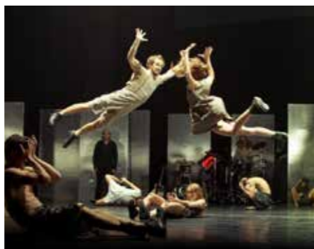
What the Body Does Not Remember de Wim Vandekeybus.

Le premier spectacle du chorégraphe Wim Vandekeybus, véritable monument de la danse contemporaine présenté en 1987, fait l'objet d'une recréation avec l'Ensemble Intercontemporain à la Philharmonie de Paris.