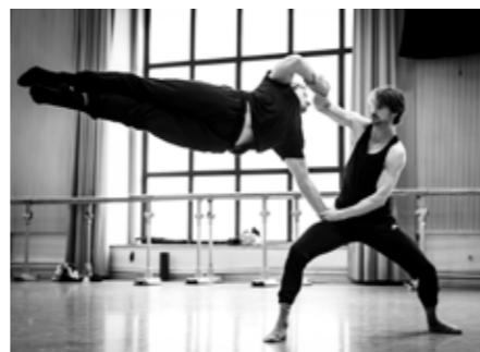
Miniature de Francesco Nappa, image de répétition.

En collaboration avec le Printemps des Arts, Les Ballets de Monte-Carlo invitent des chorégraphes amis pour une soirée Miniatures qui les associe à des œuvres musicales contemporaines.