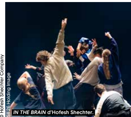
IN THE BRAIN d'Hofesh Shechter.

Shechter transforme le plateau en un espace de libération totale : un lieu où les récits s'effacent, où l'identité se dissout dans le rythme, où seule demeure la pulsation. Portés par l'énergie de Shechter II, les interprètes ne dansent pas : ils lâchent prise, débordent, happent le public dans une euphorie partagée. Avec IN THE BRAIN le théâtre devient un rituel contemporain, une fête électrique où