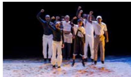
tamU/UnIU de Paulo Azevedo par la Cie Via Katlehong.

Impulsé par Théâtres en Dracénie, le festival L'impruDanse célèbre ses 10 ans avec une édition qui fait la part belle aux danses urbaines.