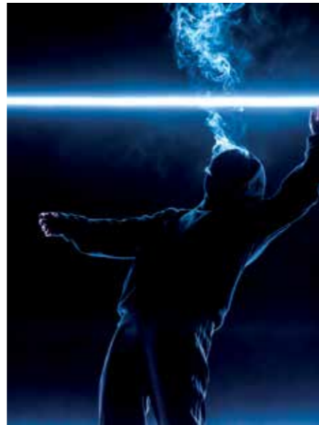
Vivarium, nouvelle création de La Vouivre, à voir au Festival Matières Vives.

Le Théâtre du Parc d'Andrézieux-Bouthéon à côté de Saint-Etienne lance un temps fort fédérateur. La naissance d'un nouveau festival de danse, c'est l'assurance d'une pensée en mouvement qui circule, et d'une liberté des corps préservée.