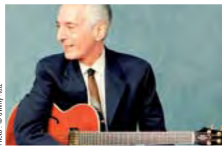
Le très rare guitariste italo-américain Pat Martino, invité du Festival Django Reinhardt à Samois-sur-Seine.

//// Hommage // QUATRE JOURS DE JAZZ EN HOMMAGE À DJANGO.