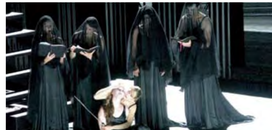
Électre aux prises avec la pitié meurtrière, dans L'Orestie d'Olivier Py.

Une DS pour ramener Agamemnon de Troie, une cuisinière pour évoquer le banquet monstrueux de Thyeste, deux oliviers descendus des cintres pour enraceriner la rationnelle conclusion qu'Athéna apporte à l'épopée monstrueuse, des cloches fort chrétiennes pour accompagner la disparition dans le ventre infernal de la scène des acteurs à la fin de la