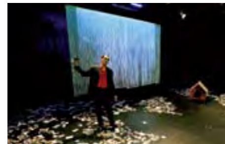
The First Cut, entre les vies possibles et les vies imaginaires.

////// Phil Hayes ////////////////////////////////////// LE MUSICIEN ET COMÉDIEN PHIL HAYES PROPOSE UNE PERFORMANCE AUTOUR DU THÈME DE L'AUTOBIOGRAPHIE, MULTIPLIANT LES POINTS DE VUE POUR MIEUX INTERROGER LA COMPLEXITÉ DU MOI.