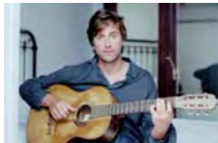
Le violoniste Didier Lockwood et le guitariste Thomas Dutronc (photo), parrains du Festival des Pucés de Saint-Ouen.