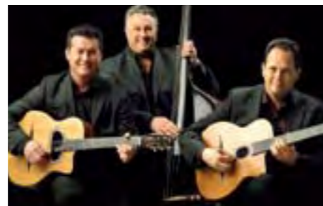
Le trio Rosenberg fait parler la poudre du swing manouche, le 28 juin dans le cadre du festival Jazz à Maisons-Laffitte.