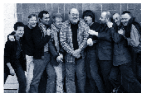
Le MegaOctet d'Andy Emler est l'invité du Tremplin Jazz d'Avignon, le 29 juillet au Cloître des Carmes.