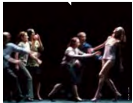
LE BLOG-NOTE DE LA RÉDACTION EN DIRECT D'AVIGNON 2008 SUR WWW.JOURNAL-LATERRASSE.FR