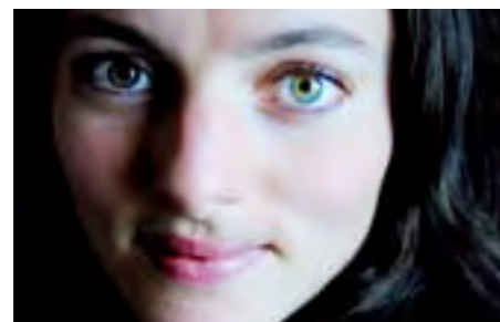
La vocaliste Maya Ratkje, personnalité emblématique de la scène norvégienne la plus innovante, est l'invitée du festival La Voix est libre, le 12 juin aux Bouffes du Nord.

Libre est la Voix DU SENS ET DES SONS : LE BOUILLONNANT FESTIVAL PROGRAMMÉ PAR BLAISE MERLIN AUX BOUFFES DU NORD EXPLORE LES FORMES LES PLUS ÉRUPTIVES ET MUSICALES DU LANGAGE.