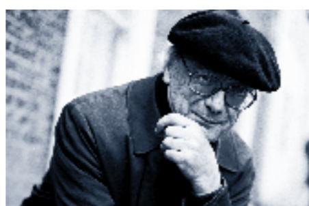
Haydn, Mozart, Beethoven et Schubert sont au programme du récital d'Alfred Brendel au Festival de La Roque d'Anthéron, le 12 août.