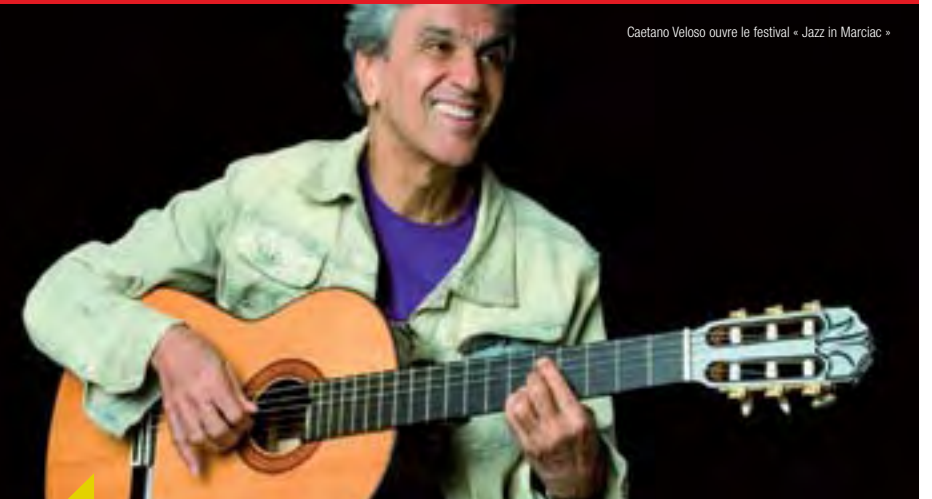
Caetano Veloso ouvre le festival « Jazz in Marciac »