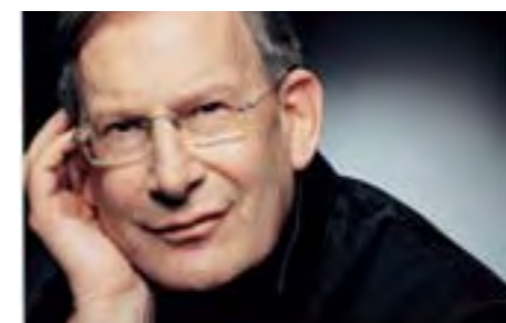
John Eliot Gardiner dirige le Requiem de Duruflé au festival de Saint-Denis le 6 juin.