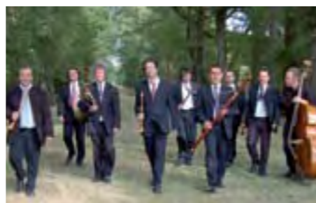
L'Ensemble A Venti donne un programme de musiques maçonnes au Logis de la Chabotterie, le 10 août.

////// Baroque ////////////////////////////////////// ORGANISÉ PAR LE FLÛTISTE HUGO REYNE, LE FESTIVAL VENDÉEN SE CONSACRE À LA MUSIQUE ANCIENNE.