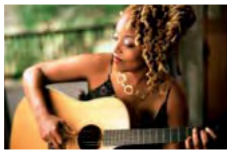
La chanteuse Cassandra Wilson, invitée des Flâneries musicales de Reims pour un grand concert gratuit en plein air le 19 juillet.

//// Flâneries // LE FESTIVAL RÉMOIS, CÉLÈBRE POUR SA PROGRAMMATION CLASSIQUE, S'OUVRE AU JAZZ.