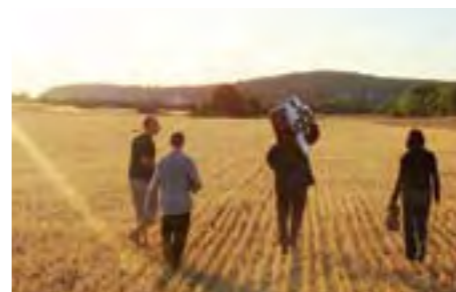
Le plateau de Larzac, cadre inhabituel pour la musique de chambre, accueille son festival du 30 juillet au 17 août.

Du 30 juillet au 17 août sur le plateau du Larzac. Tél. 05 65 62 24 21.