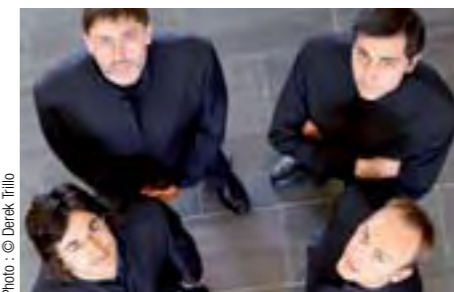
Le Quatuor Daniel prend ses quartiers d'été à l'Abbaye du Pin du 31 juillet au 2 août.

////// Musique de chambre ////////////////////////////////////// RÉSIDENCE ESTIVALE HABITUELLE DU QUATUOR DANIEL, L'ABBAYE POITEVINE ACCUEILLE CETTE ANNÉE ENCORE LES AMATEURS DE MUSIQUE DE CHAMBRE, QU'ILS SOIENT JEUNES MUSICIENS OU MÉLOMANES.